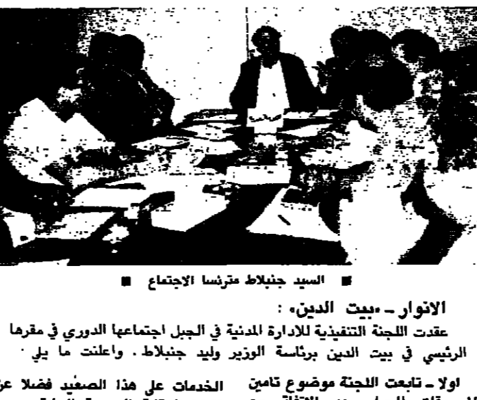
السيد جنبلاط يترأس الاجتماع